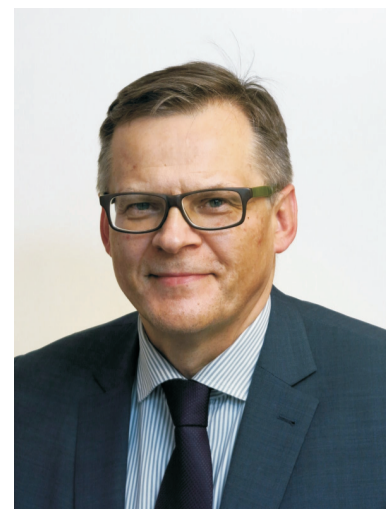
PREZES KASY ROLNICZEGO UBEZPIECZENIA SPOŁECZNEGO